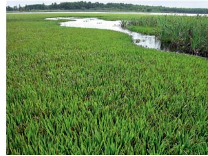
Abb. 1: Krebsscherenbestand im Uferbereich eines Sees in Ostpolen. Die Bestände bilden dichte Teppiche aus, in denen praktisch keine andere Pflanzenart wächst.

Das Verbreitungsareal der Grünen Mosaikjungfer erstreckt sich von den Niederlanden über Norddeutschland und Südschweden bis Westsibirien. In Süd- und Mitteldeutschland oder auch in der Schweiz kommt die Art nicht vor (DIJKSTRA & LEWINGTON 2006).