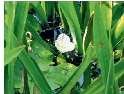
Abb. 2: Detail aus einem Bestand der Krebsschere ( Stratiotes aloides ). Zwischen den Rosetten sind Schwimmblätter und eine Blüte des Froschbisses ( Hydrocharis morsus-ranae ) sowie Wasserlinsen ( Lemna sp.) zu sehen.