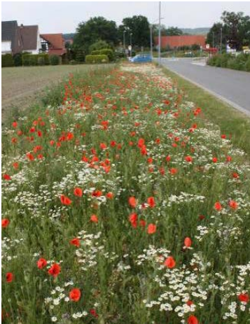
Landschaftssaum Wallenhorst (Stadtweg) nach 9 Monaten, Ansaat mit 27 Arten