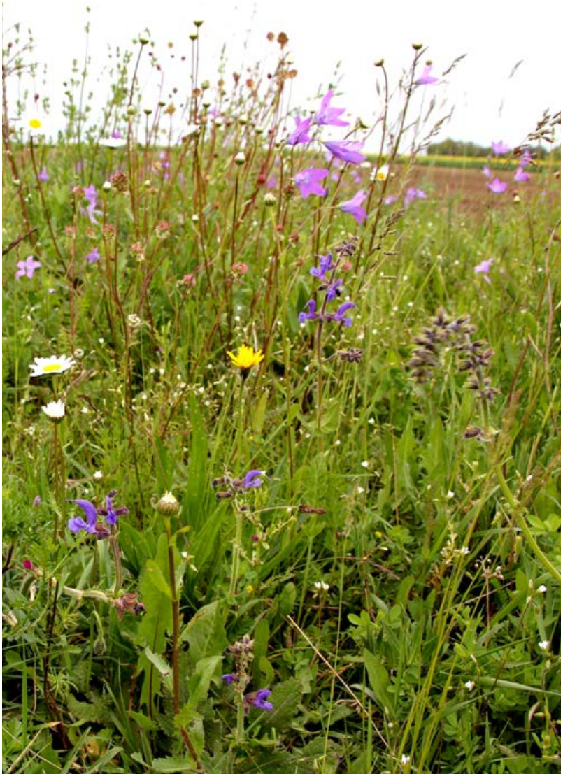
Erfolgreiche Renaturierung eines struktur- und artenreichen Felddrains, Frühsommeraspekt im 4. Jahr nach der Ansaat [31]