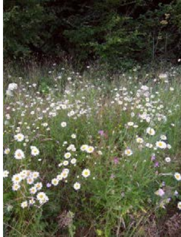
Landschaftssaum Osnabrück (Im Hone) nach 22 Monaten, Ansaat mit 27 Arten