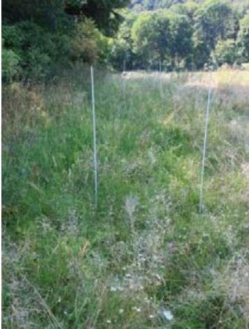
Landschaftssaum Osnabrück (Im Hone) nach 10 Monaten, Ansaat mit 27 Arten