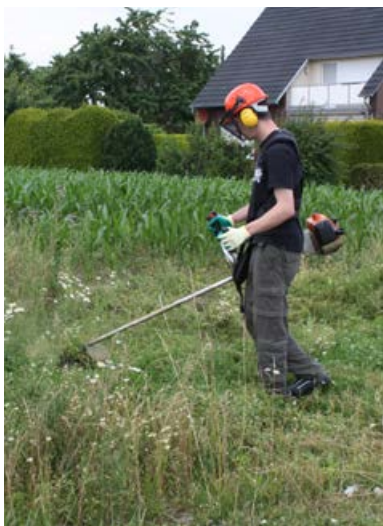
Selektives Ausmähen von Disteln [22]