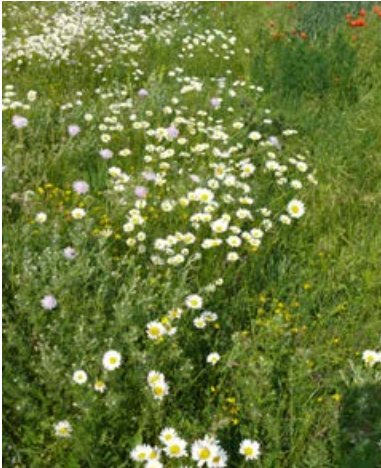
Blockversuch Bernburg nach 20 Monaten, Ansaat mit 49 Arten, Vorbehandlung 1x Fräsen, Folgepflege Juni-Mahd