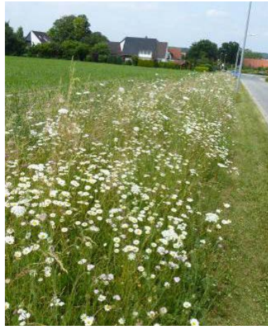
Landschaftssaum Wallenhorst (Stadtweg) nach 22 Monaten, Ansaat mit 27 Arten