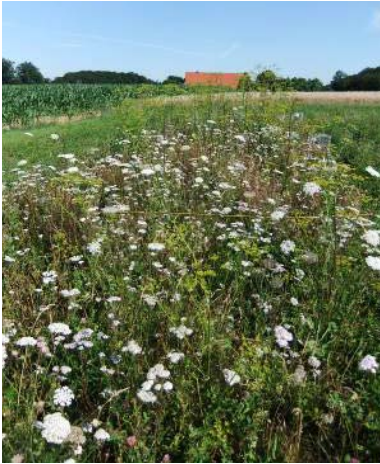
Blockversuch Wallenhorst nach 22 Monaten, Ansaat mit 37 Arten, Vorbehandlung 1x Fräsen, Folgepflege September