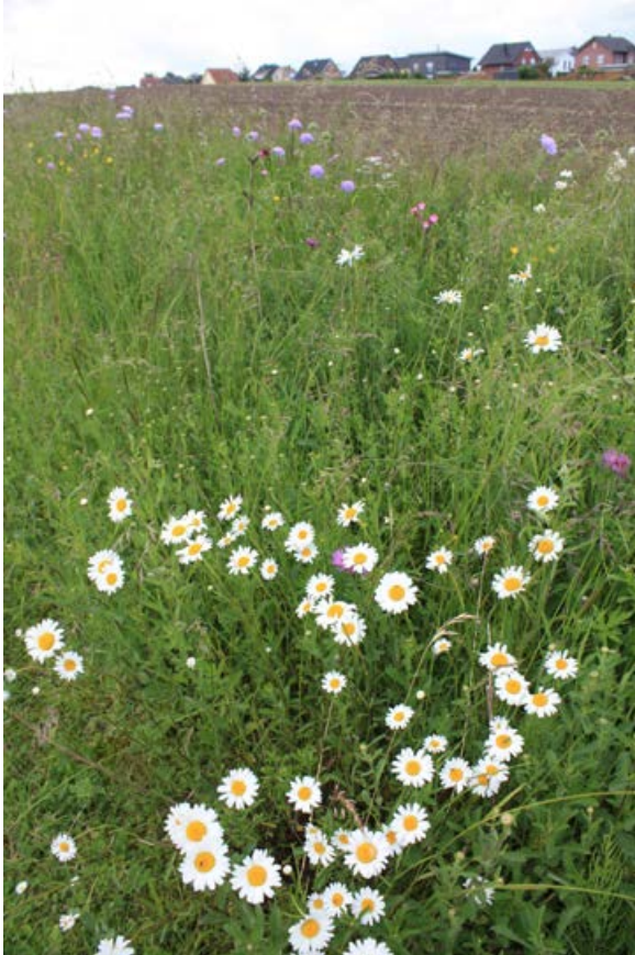
Neu angelegter Feldrain auf einer Gemeindefläche im Landkreis Osnabrück, 33 Monate nach der Ansaat [27]

Da von blütenreichen mehrjährigen Wildpflanzensäumen oftmals verschiedene Nutzer- bzw. Gesellschaftsgruppen profitieren, hat es sich in der Praxis als erfolgreich erwiesen, wenn mehrere Nutzergruppen an der Planung, Umsetzung und Pflege beteiligt sind. So können regionale Kooperationen von Landwirten, Imkern, Jägern, Vereinen, Verbänden, Stiftungen und/oder lokalen Initiativen von Bürgern in gemeinsamer Regie aktiv werden. Eine Umfrage der Hochschule Osnabrück unter verschiedenen Akteuren aus der Praxis hat gezeigt, dass die eine solche Zusammenarbeit vielfach erwünscht ist (Budelmann et al. 2017).