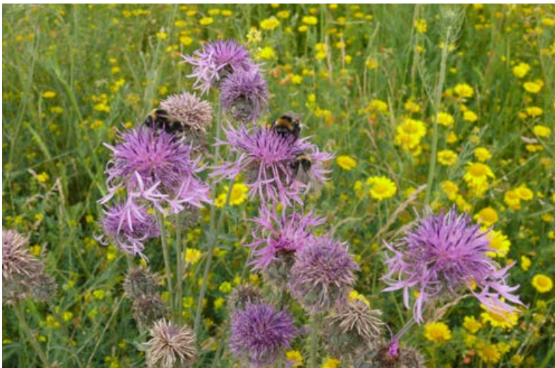
Hummeln auf Skabiosen-Flockenblumenblüten; im Hintergrund Färber-Hundskamille.