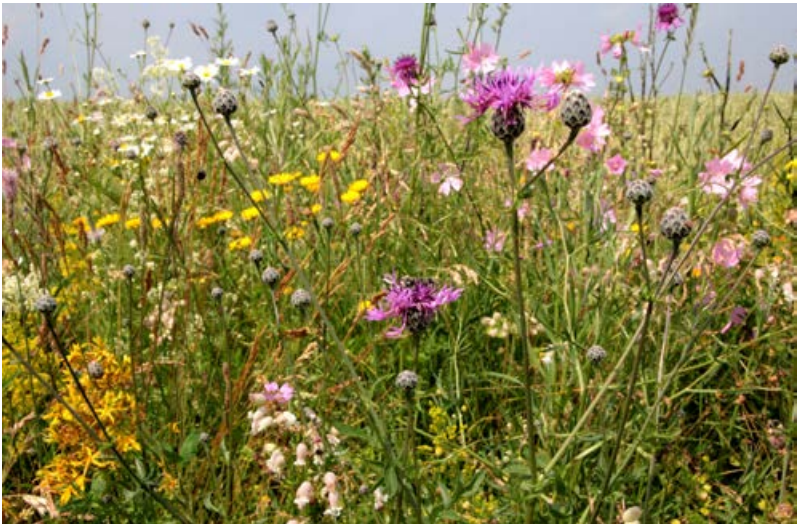
Artenreicher Feldrain im 3. Jahr [23]

Artenreiche und langandauernd blühende Bestände dienen vom Frühjahr bis zum Herbst als Nahrungsquelle für verschiedenste Insekten-Arten. Obwohl in der Literatur die Mahd von Saumstrukturen im Spätsommer befürwortet wird (ggf. sogar nur alle 2-3 Jahre), empfehlen wir aufgrund unserer bisherigen Projektergebnisse auf nährstoffreichen Standorten eine Mahd mit Entfernen der Biomasse im Frühsommer (je nach Fortschritt der Vegetationsentwicklung Mitte Mai bis Mitte Juni). Bei einer Spätsommermahd gingen auf nährstoffreichen Versuchsflächen bereits im 3. Jahr die Deckungen der angesäten Zielarten zurück, während Gräser zunahm (Kiehl et al. 2014, Kirmer et al. 2018, Kiehl & Kirmer 2019). Vor allem Rhizomgräser wie die Quecke profitieren dabei von einer späteren Mahd. Die frühere Mahd hat zudem den Vorteil, dass der Aufwuchs als wertvolles Kräuterheu verwendet werden kann.