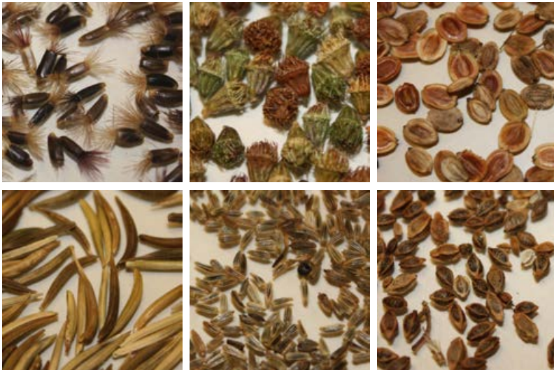
Samen und Früchte verschiedener Pflanzenarten: Von links oben nach rechts unten: Skabiosen-Flockenblume, Kleiner Odermennig, Gewöhnlicher Pastinak, Wiesen-Bocksbart, Wiesen-Margerite, Kleiner Wiesenknopf* [11]

Besonders wichtig für die Artenauswahl sind die Bodeneigenschaften (z. B. sandig oder lehmig, sauer oder basenreich), die Feuchtebedingungen (z. B. trocken, frisch oder feucht) und die Beschattung. Als Saumstandorte eignen sich vor allem unbeschattete bis mäßig beschattete Bereiche. Für nährstoffreiche Böden müssen Arten ausgewählt werden, die einerseits konkurrenzkräftig genug sind, um sich gegenüber unerwünschten Gräsern und Ruderalarten durchsetzen zu können und andererseits nicht dazu neigen, Dominanzbestände zu bilden. Auf nährstoffärmeren Böden können auch konkurrenzschwächere Arten beigegeben werden.