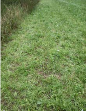
Landschaftssaum Wallenhorst (B68-3) nach 10 Monaten, Ansaat mit 27 Arten