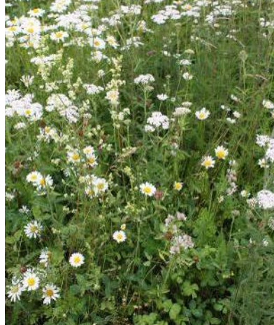
Blockversuch Wallenhorst nach 33 Monaten, Ansaat mit 37 Arten, Vorbehandlung 1x Fräsen, Folgepflege September