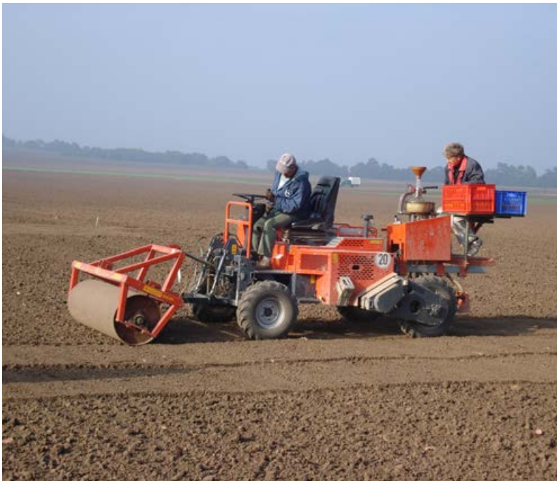
Ansaat mit kombinierter Drillmaschine [17]

Die Ansaat kann sowohl von Hand (kleinere Flächen bis 5000 m 2 ) als auch maschinell mit verschiedenen Sä- und Streugeräten erfolgen (Beispiele siehe Krautzer et al. 2012). Da die meisten Wildpflanzen Lichtkeimer sind, ist es wichtig, das Saatgut nicht in den Boden einzuarbeiten, sondern nur oberflächlich abzulegen. Bei der Verwendung von Drillmaschinen müssen deshalb Striegel und Säscharen hochgeklappt werden. Nach der Ansaat muss die Fläche mit einer Strukturwalze (z. B. Cambridge- oder Güttlerwalze) gewalzt werden, um den Bodenschluss der Samen herzustellen.