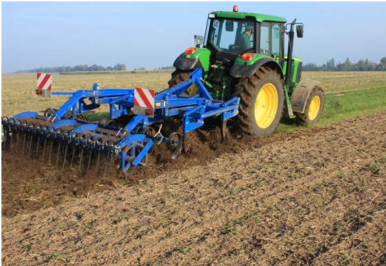
Bodenvorbereitung durch Grubbern [16]

Eine wichtige Voraussetzung für eine erfolgreiche Aufwertung bzw. Neuanlage blütenreicher mehrjähriger Säume und Feldraine ist eine intensive Bodenstörung (Jeschke et al. 2012, Kiehl et al. 2014). Bei Aufwertungen von Grassäumen ist der Etablierungserfolg der angesäten Arten umso höher, je gründlicher die Grasnarbe zerstört wird. Die Bodenbearbeitung kann durch Fräsen, Grubbern oder Pflügen erfolgen. Anschließend sollte mit einer Egge oder Kreiselegge ein möglichst feines Saatbett hergestellt werden (für Lichtkeimer besonders wichtig).