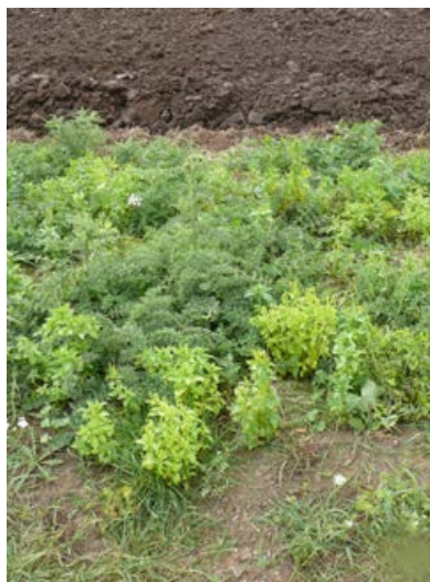
Massenauftritt von Weg-Distel [21]

Besteht die Gefahr, dass problematische Arten (z. B. Kletten, Weg-Distel, Acker-Kratzdistel, Stumpflättriger Ampfer, Krauser Ampfer) oder invasive Neophyten sich zu Dominanzbeständen entwickeln, sollten zusätzliche Managementmaßnahmen, wie z. B. das regelmäßige Ausmähen betroffener Bereiche oder ein selektives Ausstechen einzelner Pflanzen eingeleitet werden. Wichtig ist, dass rechtzeitig, d.h. deutlich vor der Samenreife der Problemarten, eingegriffen wird. Eine Mahd im Knosp stadium hat sich beim Zurückdrängen von Distelarten besonders bewährt.