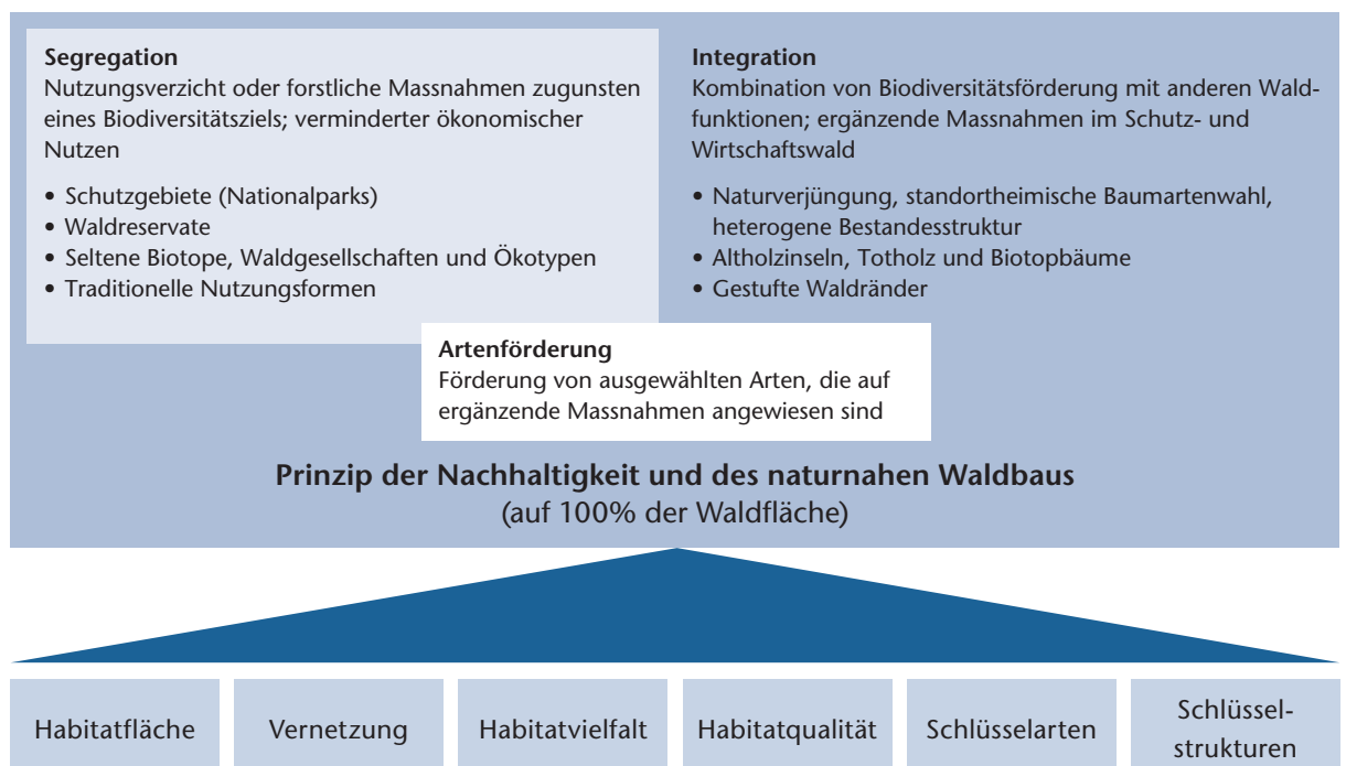
Abb 3 Konzepte, Prinzipien, Instrumente und Massnahmen zur Biodiversitätsförderung im Wald.

Naturschutz kümmerte sich über lange Zeit vor allem um Spezialstandorte im Wald, die nach den Kriterien Seltenheit, Besonderheit, Artenzusammensetzung und auch Ästhetik ausgewählt wurden. Dabei handelt es sich oft um Waldbestände auf sehr trockenen, flachgründigen oder nassen Standorten wie Auen-, Moor-, Bruch-, Schlucht- oder Orchideenwälder (vgl. Verordnung vom 16. Januar 1991 über