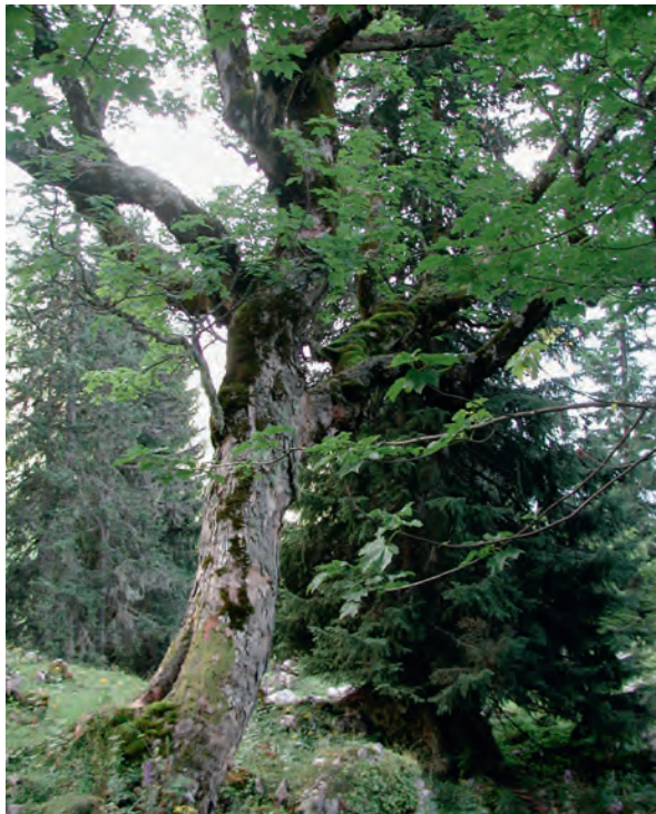
Abb 6 Biotopbäume sind häufig alte Baumindividuen, die zahl-reichen spezialisierten und gefährdeten Arten einen Lebens-raum bieten. Dazu gehört auch Tayloria rudolphiana (Abbil-dung 1), ein Moos, das nur auf ausladenden Ästen des Bergahorns wächst.