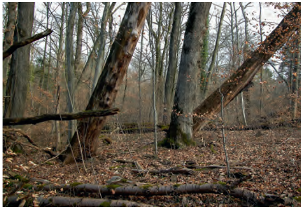
Abb 5 Für die Biodiversitätsförderung braucht es mehr Pensio-näre im Wald. Habitatspezialisten wie beispielsweise die Steck-nadelflechten sind auf Altholzbestände im Zerfallstadium ange-wiesen.