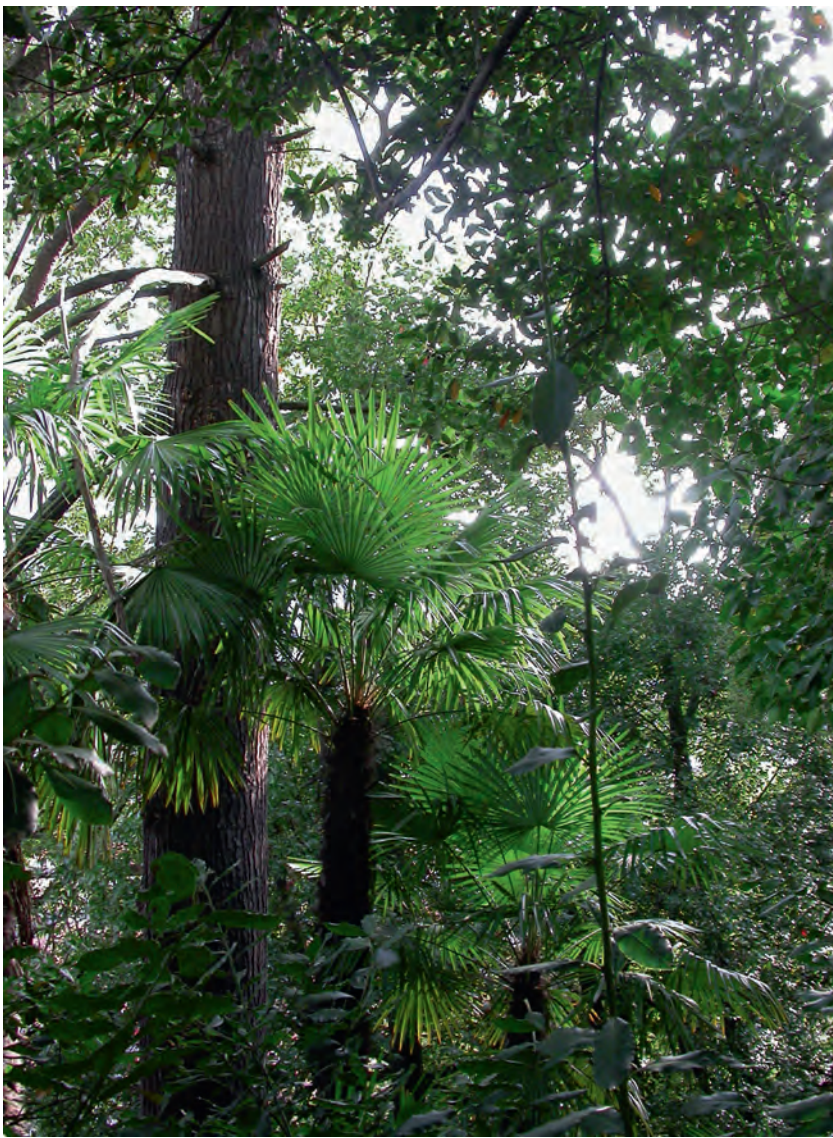
Abb 10 Neophyten haben im Tessin in siedlungsnahen Wäldern stark zugenommen.

ten von Klimaänderungen sind Waldschäden, die durch Insekten und Pathogene verursacht werden. In Kanada und Alaska wird vermutet, dass eine Folge warmer Sommer die Borkenkäferpopulationen derart begünstigten, dass grosse Wälder flächig abgestorben sind (Logan et al 2003). Wenig bekannt sind auch Effekte veränderter Konkurrenzverhältnisse auf das Vorkommen der Arten. Insgesamt ist es schwierig, die Auswirkungen zukünftiger Klimata auf die Verbreitung von Waldarten vorauszusagen.