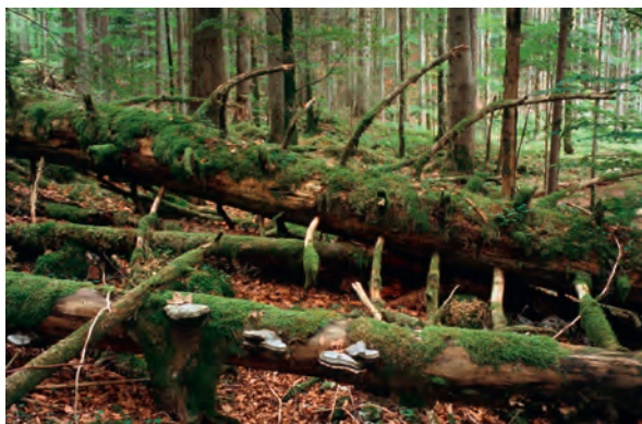
Abb 7 Liegendes und stehendes Totholz sind wichtige Schlüs-selstrukturen und Lebensraum für Tausende von Arten im Wald.

autochthone Provenienzen verwendet werden, weil solche Organismen besser an die regionalen Be-dingungen angepasst sind und ein grösseres Anpas-sungspotenzial für zukünftige Umweltverände-rungen aufweisen (Bonfils & Bolliger 2003). Aus forstpolitischen Überlegungen wird in der Schweiz mit grosser Wahrscheinlichkeit am Prinzip der multifunktionalen Waldwirtschaft festgehalten. Es ist aber in Zukunft mit einer Intensivierung der Holznutzung zu rechnen. Diese kann für den Schutz der Biodiversität sowohl ein Risiko als auch eine Chance darstellen. Eine Chance eröffnet sich dann, wenn die gesteigerte Holznutzung mit zusätzli-chen, integrativen Massnahmen für die Biodiversi-tätsförderung kombiniert wird. Diese Massnahmen und Instrumente sind im Folgenden genauer be-schrieben.