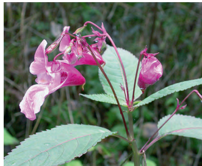
Abb 11 Viele invasive Neobiota wie das Drüsiges Springkraut ( Impatiens glandulifera ) breiten sich in aufgelichteten Wäldern rasch aus.

Die Ausbreitung gebietsfremder Arten ist ein weltweites Phänomen, das auch in der Schweiz an Bedeutung gewinnt. Eine Übersicht der hierzulande bekannten Neobiota – dies sind Organismen, die nach der Entdeckung Amerikas (1492) in der Schweiz erstmals auftraten – gibt Wittenberg (2005). Seither kamen ständig neue Arten hinzu. So wurden allein im Jahr 2007 vier neue Insektenarten auf Gehölzpflanzen bekannt (Engesser et al 2008a). Invasive Neobiota können im Wald als Schadorganismen auftreten (Heiniger 2003, Engesser et al 2008b) und einheimische Arten direkt gefährden. Ein Beispiel ist die Ulmenwelke, die durch den aus Ostasien eingeschleppten Schlauchpilz Ophiostoma ulmi ausgelöst wurde. Gebietsfremde Arten können im Wald auch indirekt die Vielfalt einheimischer Arten verringern. Beispiele hierfür sind die zunehmende Beschattung durch die Laurophyllisierung sowie die Stickstoffanreicherung durch Robinie (SKEW 2006). Obwohl bei einer weltweiten Betrachtung invasive Neobiota bereits grossräumig zu deutlichen Veränderungen in Wäldern geführt haben, ist ihre Bedeutung in der Schweiz noch gering. Ein besonderes Augenmerk muss jedoch auf Arten gerichtet werden,