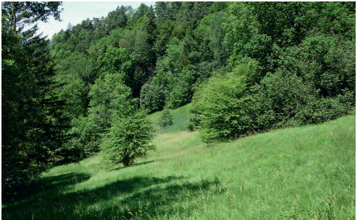
Abb 8 Der artenreiche, reich strukturierte Waldrand mit Krautsaum, Büschen und Pionierbäumen ist der bevorzugte Lebensraum für licht- und wärmebedürftige Arten.

telte minimale Totholzvorrat ist, sollten in Wäldern mit wenig Totholz einzelne Inseln im Sinne des ökologischen Ausgleichs ausgeschieden werden. Diese sollten mindestens die Lebensraumansprüche von typischen Schirmarten des totholzreichen Waldes (z.B. Dreizehenspecht, Weissrückenspecht) erfüllen. Um dies zu erreichen, empfehlen Bütler & Schlaepfer (2004), in der Waldlandschaft Schweiz rund 1 km 2 grosse Totholzinseln zu verteilen. Diese sollen über 9% Totholz verfügen, was durchschnittlich 33 m 3 /ha stehendem und liegendem Totholz entspricht. Für ausgesprochene Habitatspezialisten wie den Weissrückenspecht ( Dendrocopos leucotos ), welcher urwaldähnliche Laubwaldbestände bewohnt, können sogar solche Zielwerte zu tief sein. Frank (2002) ermittelte für diesen in Österreich einen Totholzanteil von 58 m 3 /ha. Im Verbreitungsgebiet des Weissrückenspechts in Nordbünden sind die Totholz mengen aber deutlich kleiner (14–16 m 3 /ha; Bühler 2001).