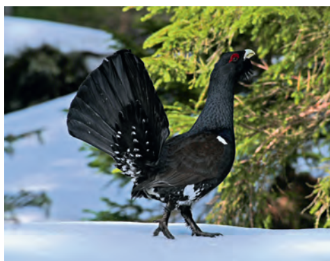
Abb 1 Artenreichtum des Waldes (l, von links nach rechts): Auerhahn ( Tetrao urogallus ); Foto: Klaus Robin. Leuchtender Weichporling ( Pycnoporellus fulgens ); Foto: Beatrice Senn-Irlet. Rudolphs Trompetenmoos ( Tayloria rudolphiana ); Foto: Norbert Schnyder. Nagelfleck ( Aglaia tau ); Foto: Beat Wermelinger. Kleiner Schmalbock ( Stenurella melanura ); Foto: Beat Wermelinger. Waldeidechse ( Zootoca vivipara ); Foto: Thomas Reich.

Ab den Siebzigerjahren des letzten Jahrhunderts wurde biologische Vielfalt als integraler Bestandteil der Waldbewirtschaftung auf der ganzen Fläche gefordert (Ewald 1982, Murri 2003). Seither genießt dieses integrative Konzept, ergänzt mit segregativen Elementen (geschützte Naturvorrangflächen), den grössten Zuspruch bei der Erhaltung der Waldbiodiversität in Kulturlandschaften (Winkel 2008).