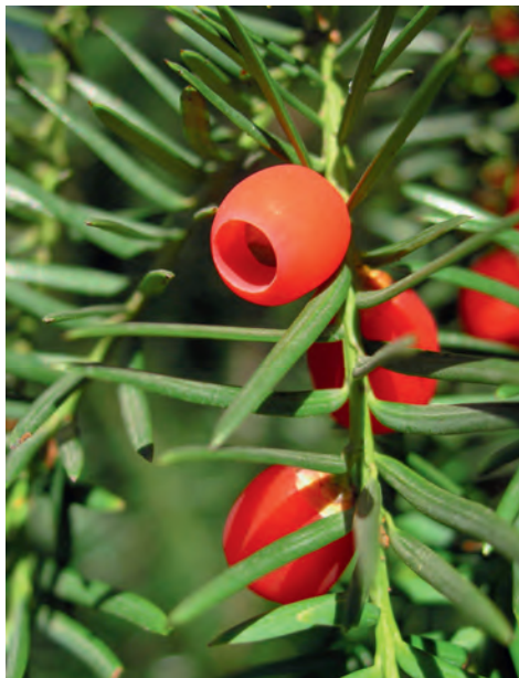
Abb 2 Artenreichtum des Waldes (II, von links nach rechts): Eibe ( Taxus baccata ); Foto: Michael Nobis. Iltis ( Mustela putorius ); Foto: Otto Holzgang. Buchenfarn ( Phegopteris connectilis ); Foto: Michael Nobis. Türkenbund ( Lilium martagon ); Foto: Markus Bolliger. Mückenfledermaus ( Pipistrellus pygmaeus ); Foto: Thomas Sattler. Engelshaarflechte ( Usnea longissima ); Foto: Christoph Scheidegger.

Neben der Grösse und der Vernetzung der Habitate spielt deren Qualität eine entscheidende Rolle für das Vorkommen und die langfristige Erhaltung der Waldarten. In den letzten Jahrzehnten ist der Schweizer Wald dunkler und dichter geworden